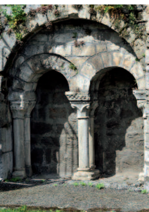
Église Saint-Ebons de Sarrancolin