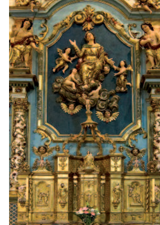
Retable - église de Bordères-Louron

★ Animation nocturne → Lieu de rendez-vous Lété des 6-12 ans