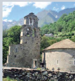
La Chapelle dite "des Templiers" - Aragnouet

Samedi 13 août à 16h30 Visite guidée de la Chapelle dite "des Templiers". → Aragnouet (Chapelle des Templiers).