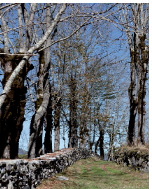
Chemin en Louron