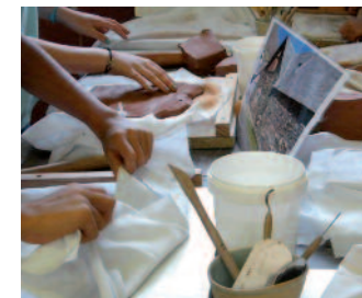
Atelier de poterie

→ L'Atelier Poterie à Arreau (embranchement route de Pailhac). Covoiturage depuis ce lieu pour la balade architecturale