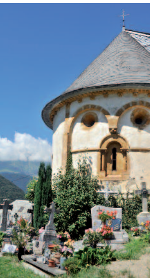
Église de Jézeau

Prévoir chaussures de marche. → Devant l'église de Cazaux-Debat (Louron)