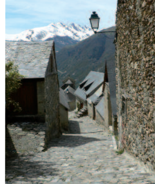
Rue pavée à Graillhen - Vallée d'Aure