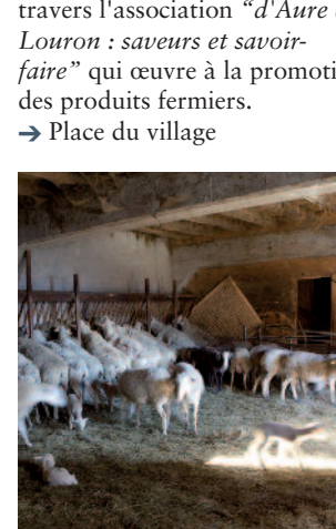
Brebis dans l'étable