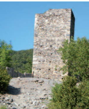
Tour de Tramezaygues