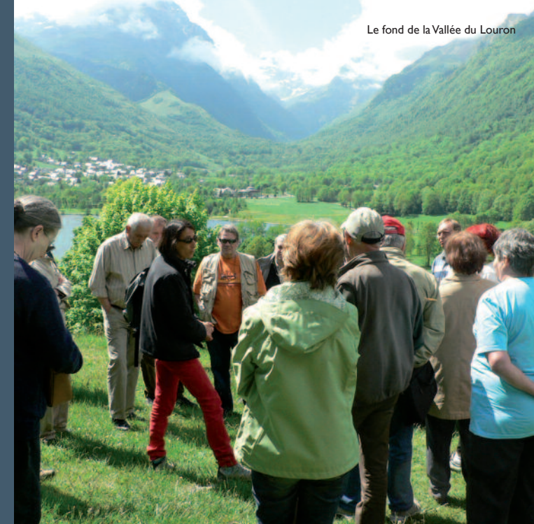
Le fond de la Vallée du Louron

Quelle que soit votre route, votre chemin d'entrée, ce pays ne se traverse plus. Il se visite. Les randonneurs eux-mêmes marquent le pas, s'y trouvent plus légers, s'arrêtent.