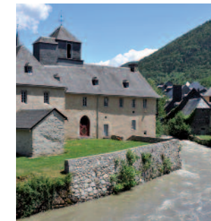
Arreau, à la confluence des vallées d'Aure et du Louron